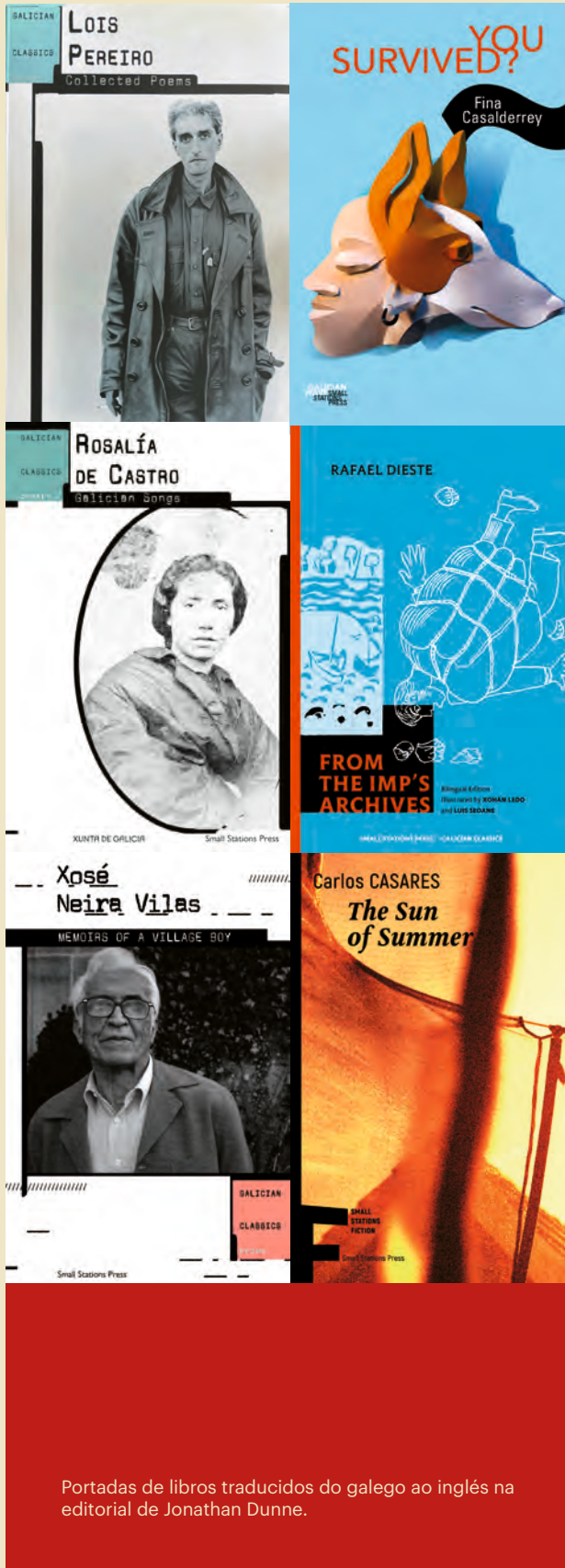
Portadas de libros traducidos do galego ao inglés na editorial de Jonathan Dunne.

ben, editado ben, distribuído e promocionado. Como chegou a nós o coñecemento escondido en letras árabes? A través da Escola de Tradutores de Toledo. Como chegou o budismo a China no século V? A través dunha oficina de tradución que montou o tradutor Kumarajiva co apoio do Emperador Yao Xing. Contaba con varios miles de monxes tradutores e especialistas teolóxicos que traballaban con el. Imaxinades o investimento que iso implica? E non só a literatura. Pasa o mesmo coa arquitectura ou coas bibliotecas. Avanzan cando hai patrocinio.